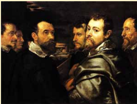
Pieter Paul Rubens - Autoretrato con amici a Mantova, 1602-1604. Olio su tela